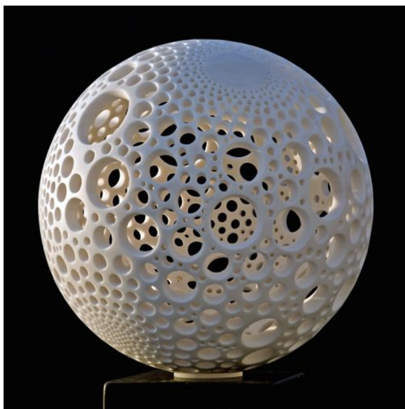
Matthias Contzen, Planet Alpha , 2010, marbre, diam. : 80 cm