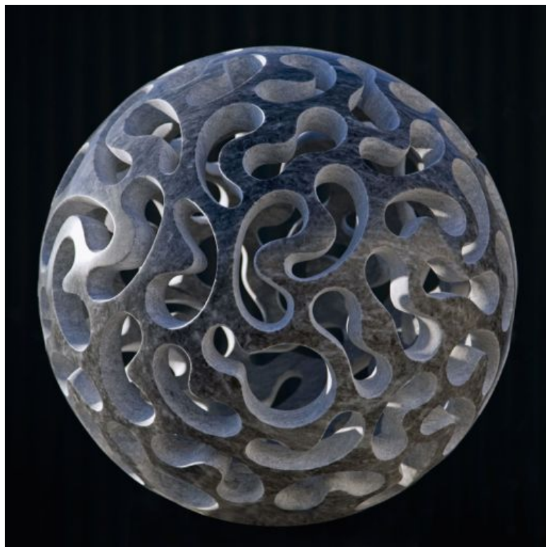
Matthias Contzen, Planet Bean , 2009, marbre, diam. : 54 cm

Univers : le mot s'impose lorsque l'on aborde l'œuvre de Matthias Contzen. Car le geste de l'artiste s'origine dans un désir profond de percer la nature des formes. Planet Bean , 2009, Planet Alpha , 2010, Planet Lucky , 2015 et Star , 2015, secrètent le principe créateur de l'univers : « mes planètes surgissent dans l'infiniment grand, quelques fragments de seconde après le Bing Bang. Pourtant leurs formes m'ont été initialement inspirées par celles de microalgues, les diatomées centriques, venues sur Terre il y a plus de 150 millions d'années », remarque l'artiste.