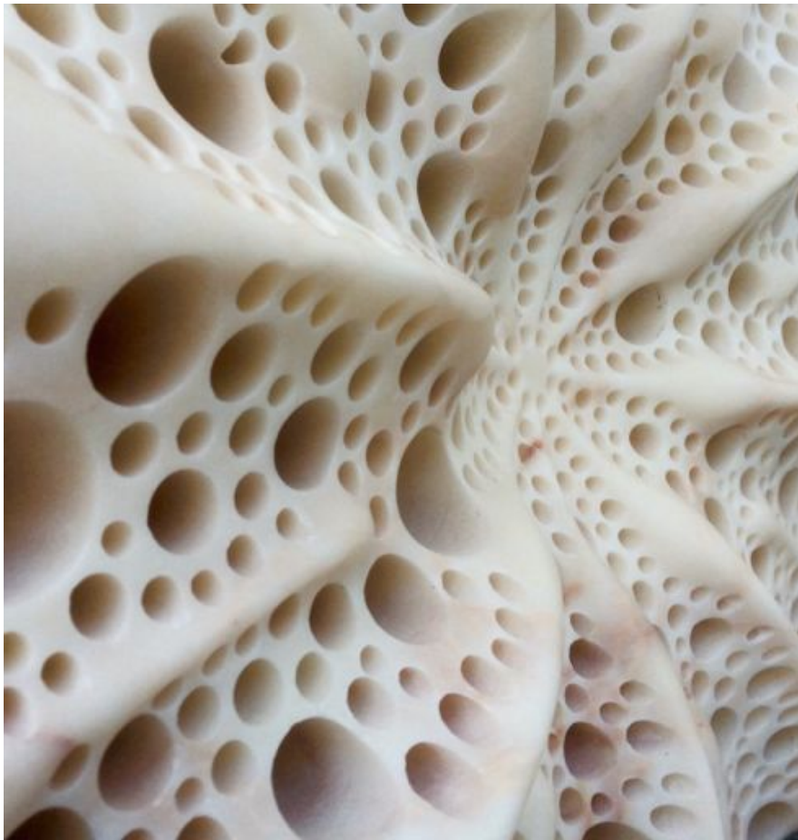
Matthias Contzen, Star , 2015 (détail), marbre, 64 x 64 x 20 cm