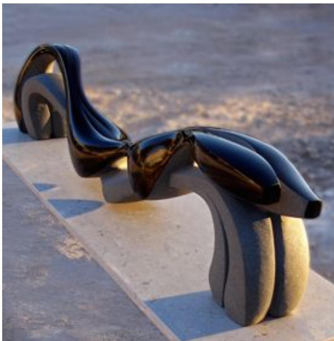
Matthias Contzen, Fusion , 2007, basalt, 190 x 42 x 22 cm

En regard de cet ensemble retraçant les dix dernières années de la création de Matthias Contzen, trois miniatures en stéatite datées des années 1980, dont la toute première sculpture de l'artiste, Dreibein , 1982, sortent pour la première fois de l'intimité du sculpteur et annoncent les intentions originelles de l'œuvre : nous révéler la beauté de l'univers, telle que nous ne la percevions plus.