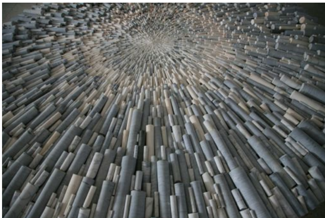
Matthias Contzen, For You , 2015 (détail), installation, mandala de marbre, diam. : 400 cm