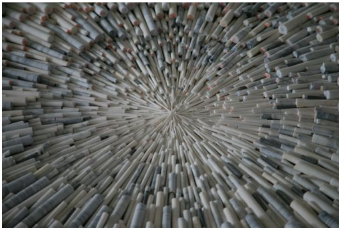
Matthias Contzen, For You , 2015 (détail), installation, mandala de marbre, diam. : 400 cm

L'installation For you s'inscrit au cœur du travail amorcé par Matthias Contzen à la fin des années 2 000 avec ses Planets , sphères de marbre évidées traversées de lumière, présentées dans l'espace du Haut Marais. Les 4 000 cylindres réunis par For you ont été collectés ces cinq dernières années au fil de ce travail. Ils sont extraits de pièces monumentales ou de formats plus modestes, dont ils nous livrent la genèse. La section de chaque cylindre comporte un nombre qui correspond au diamètre de chaque ouverture pratiquée dans ces pièces : à rebours, l'installation nous donne à voir le processus de création même. Elle témoigne aussi et surtout de la recherche de l'artiste : traduire l'équilibre perpétuel d'un univers fait de complémentarités.