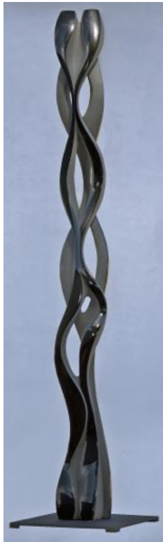
Matthias Contzen, Slow motion , 2010, basalt, 190 x 30 x 20 cm