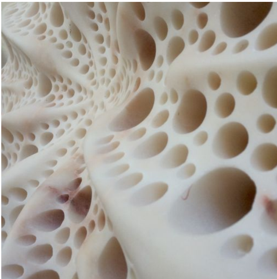
Matthias Contzen, Star , 2015 (détail), marbre, 64 x 64 x 20 cm