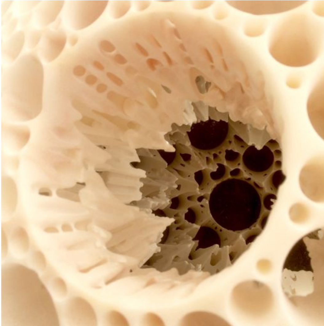
Matthias Contzen, Planet Lucky , 2015 (détail) marbre, diam. : 72 cm

L'énigme des formes est celle des sons. Les sons créent les formes : chaque Planet est l'expression d'une composition sonore singulière. « Dès mes premières sculptures, j'ai eu cette intuition très forte d'un lien entre formes et sons », explique Matthias Contzen. « La découverte de la cymatique fut celle d'une évidence. Mon vocabulaire formel naît de vibrations. Ma première installation visuelle et sonore, Planet, conçue avec Philippine Leroy-Beaulieu lors de Nuit Blanche 2014, en collaboration avec Sven Meyer et John Hassell dont la musique jouée en live était rendue visible par des projections cymatiques, explicitait cette idée ».