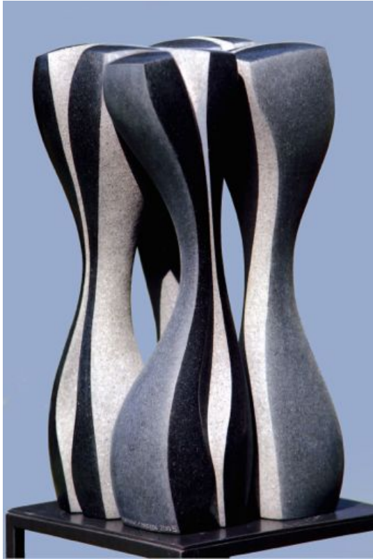
Matthias Contzen, Together we are strong , 2005 Basalt, 20 x 21 x 40 cm