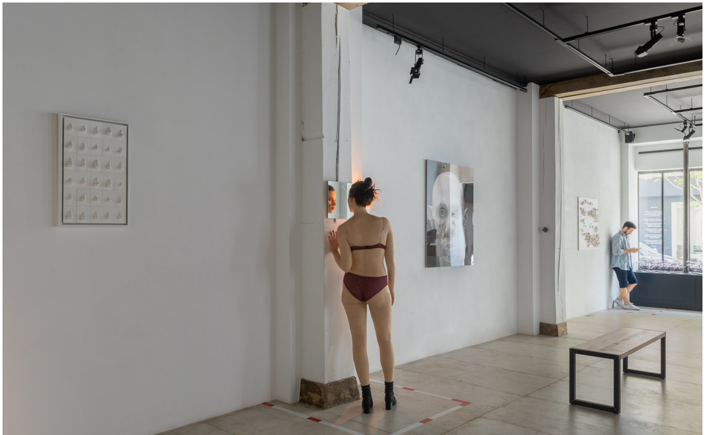
Vues de l'exposition Find Yourself , Loo & Lou Gallery - Haut Marais, 2020