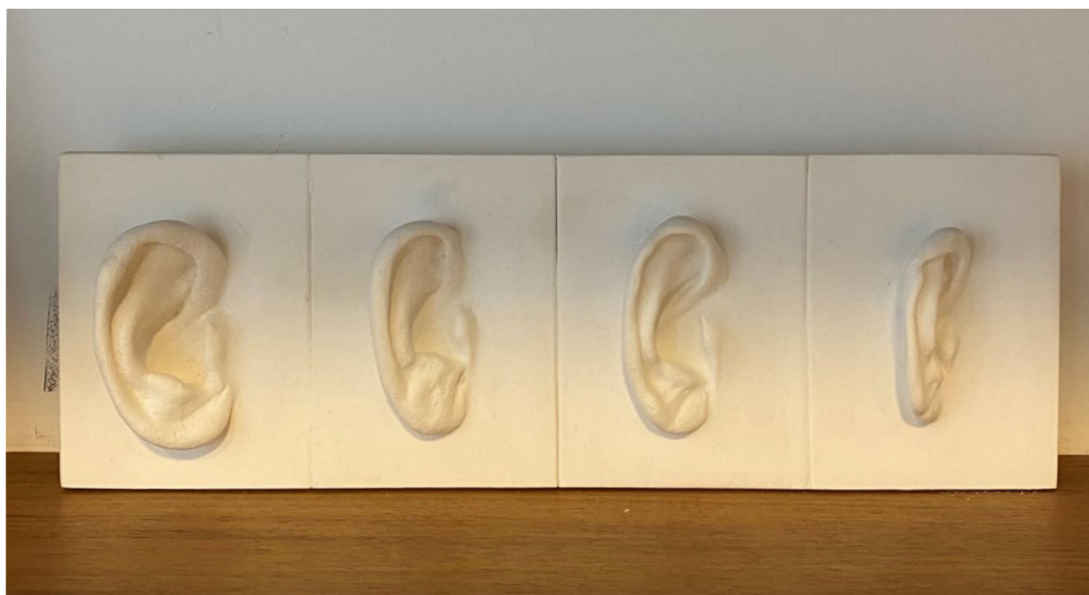
Oreilles (Quatre) (2017)

Plâtre marbre 31,5 x 10,5 x 1 cm 440 euros