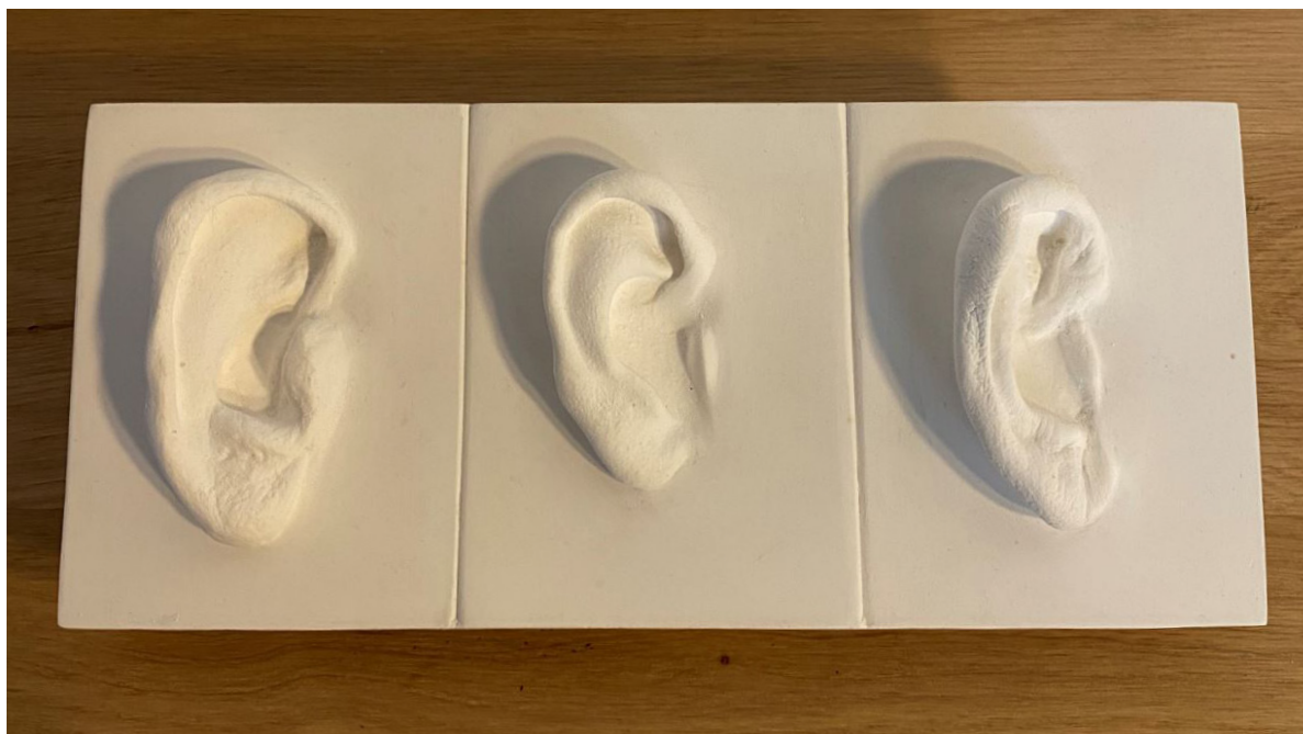
Oreilles (Trois) (2017) Plâtre marbre 23,5 x 10,5 x 1 cm 330 euros