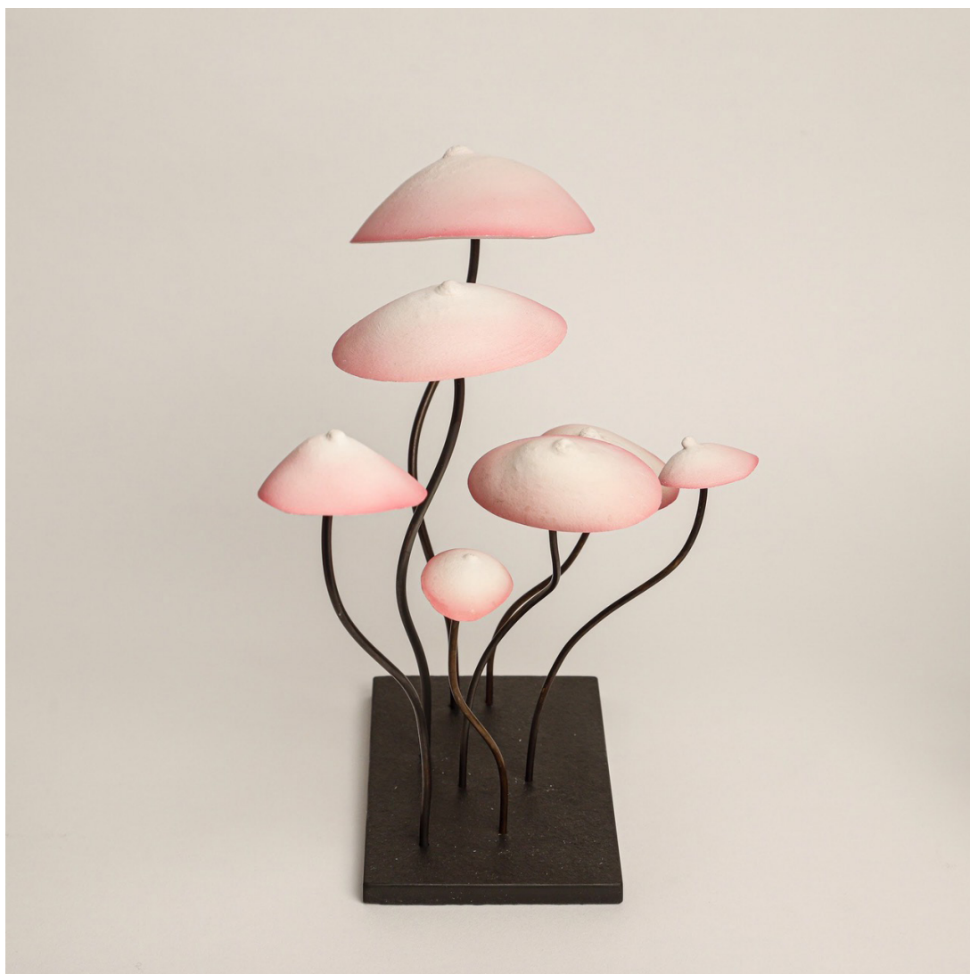
Breast pépinière rose (2020) Pousse de 7 champignons Plâtre marbre, métal, ardoise 20 x 10 x 16 cm Pièce unique 990 euros