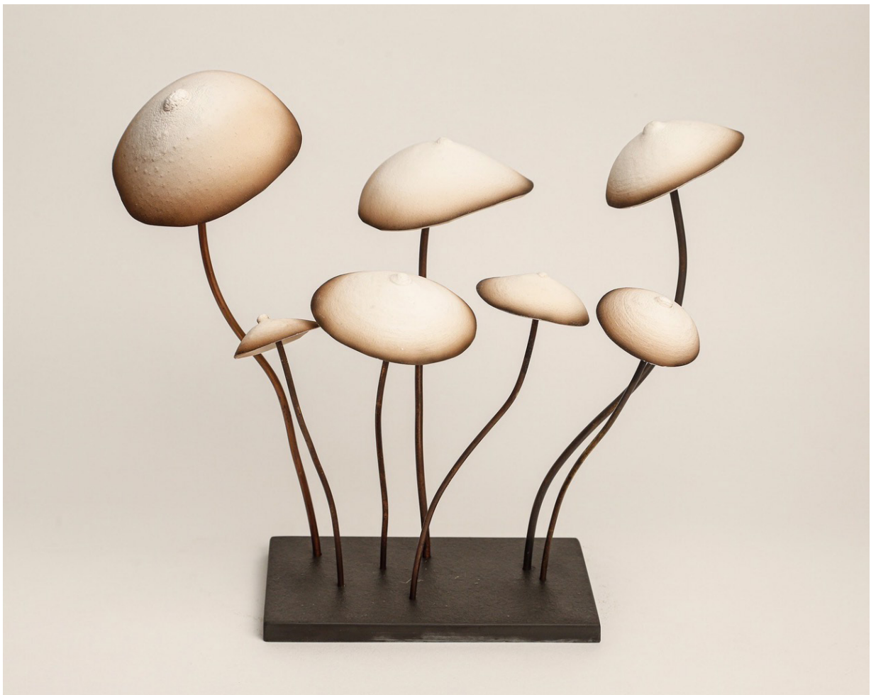
Breast pépinière marron (2020)