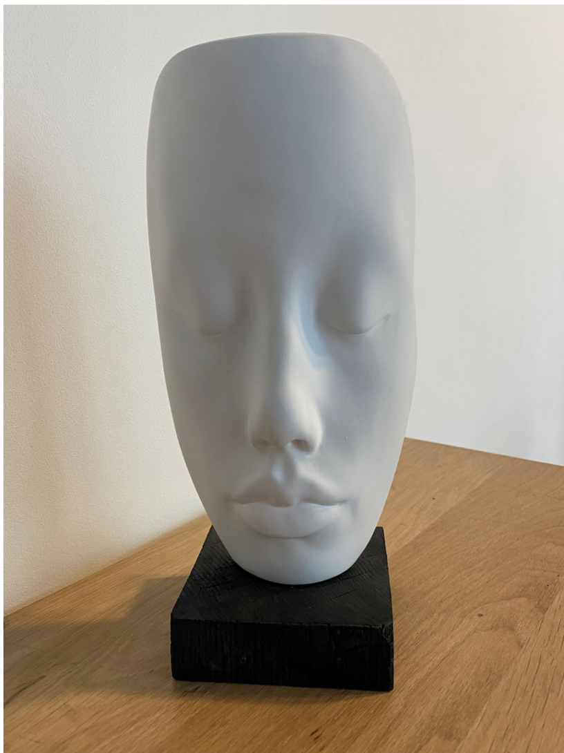
Léa (2016) Jesmonite, socle en bois brûlé 12 x 26 x 10 cm 990 euros