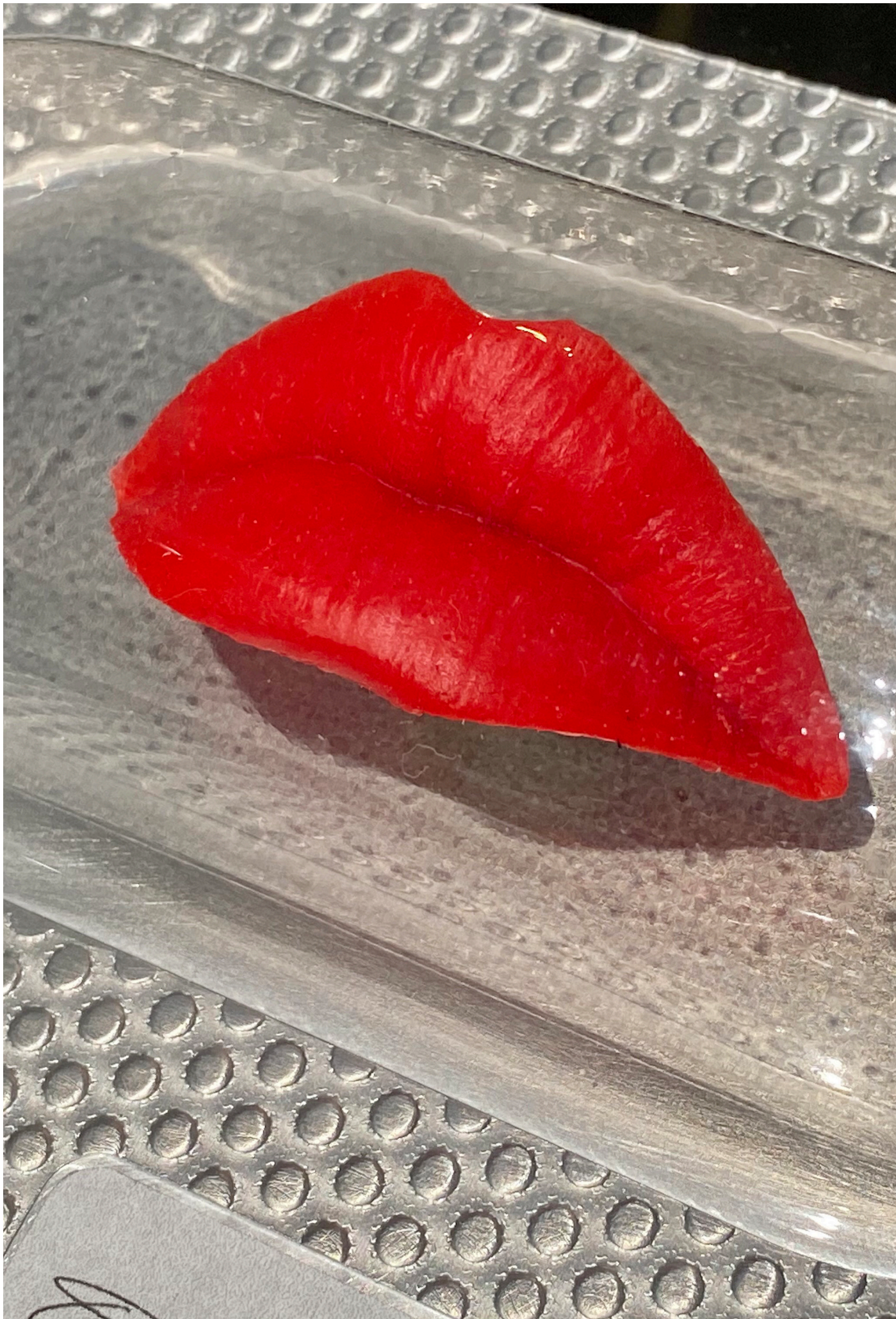
Blister (détail), 2018, Silicone, plexi, métal, 18 x 11 x 3 cm