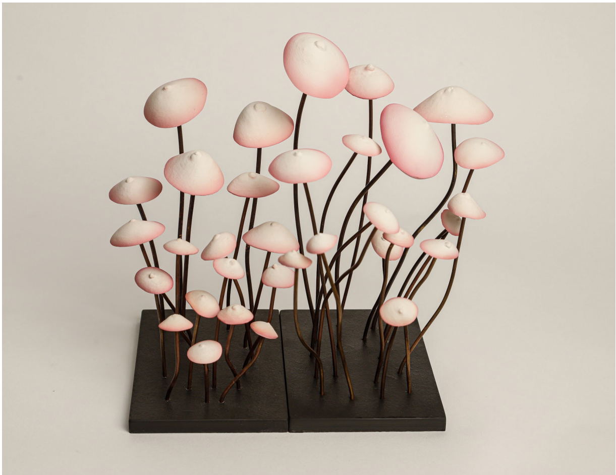
Breast pépinières roses (2020) Pousse de 16 champignons (deux oeuvres affichées) Plâtre marbre, métal, ardoise 31 x 20 x 16 cm 1 540 euros chacune