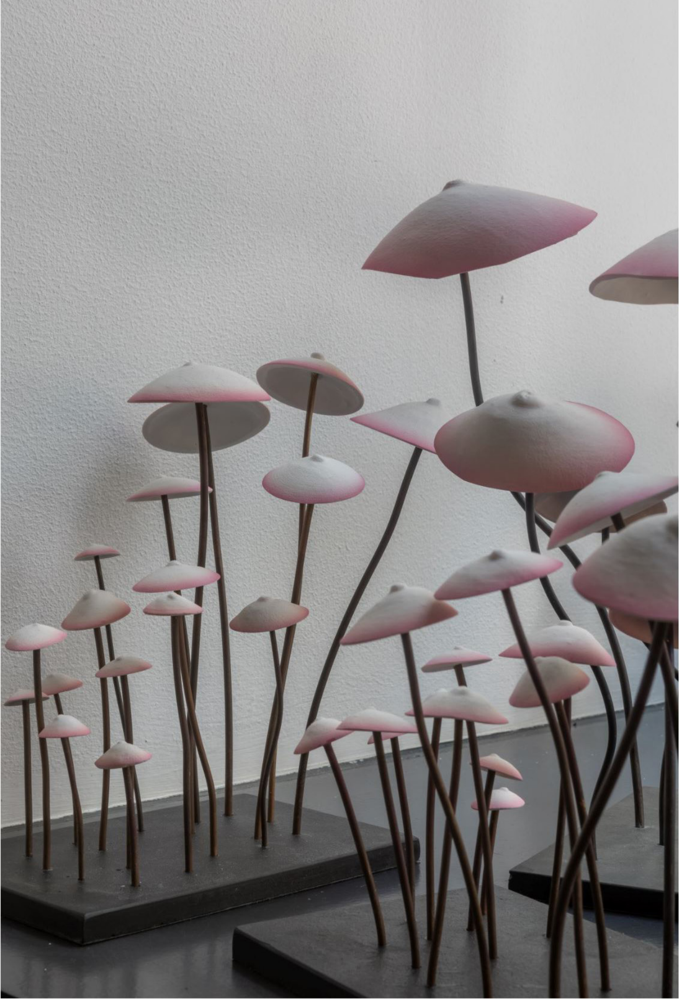
Vue de l'exposition Find Yourself, Loo and Lou Gallery – Haut Marais, 2020